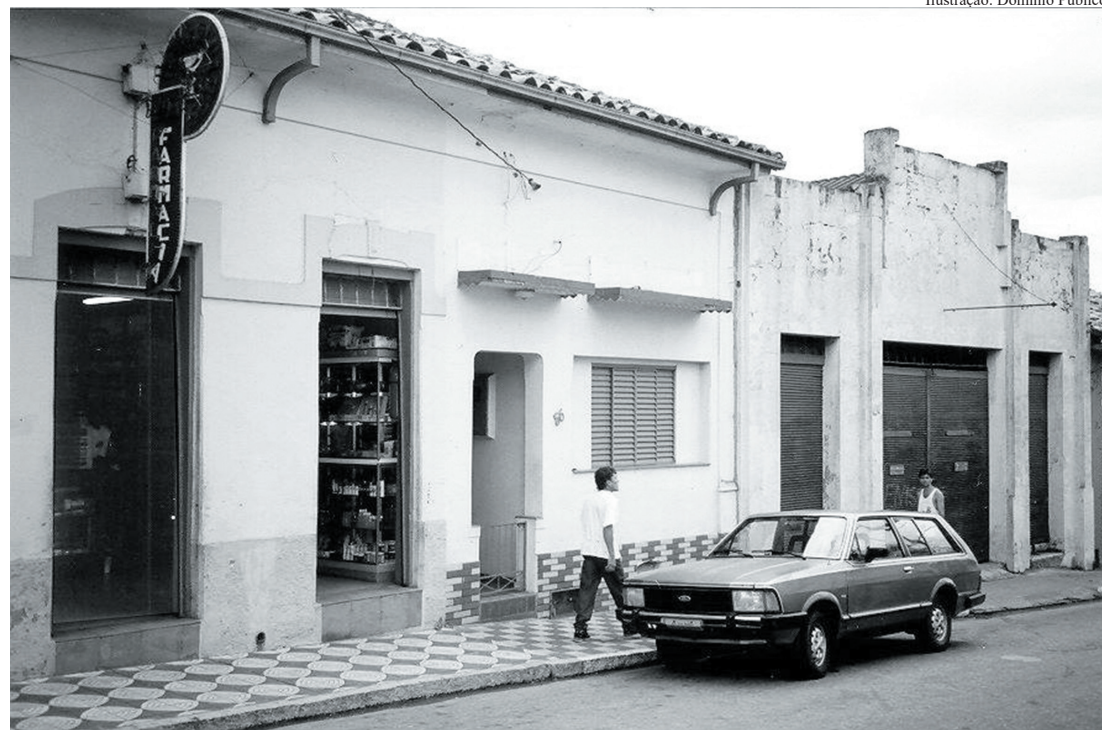
Ilustração: Domínio Público

Não obstante o progresso busque a modernização, o crescimento econômico e novas construções, o casario antigo representa, indiscutivelmente, a história, a iden-