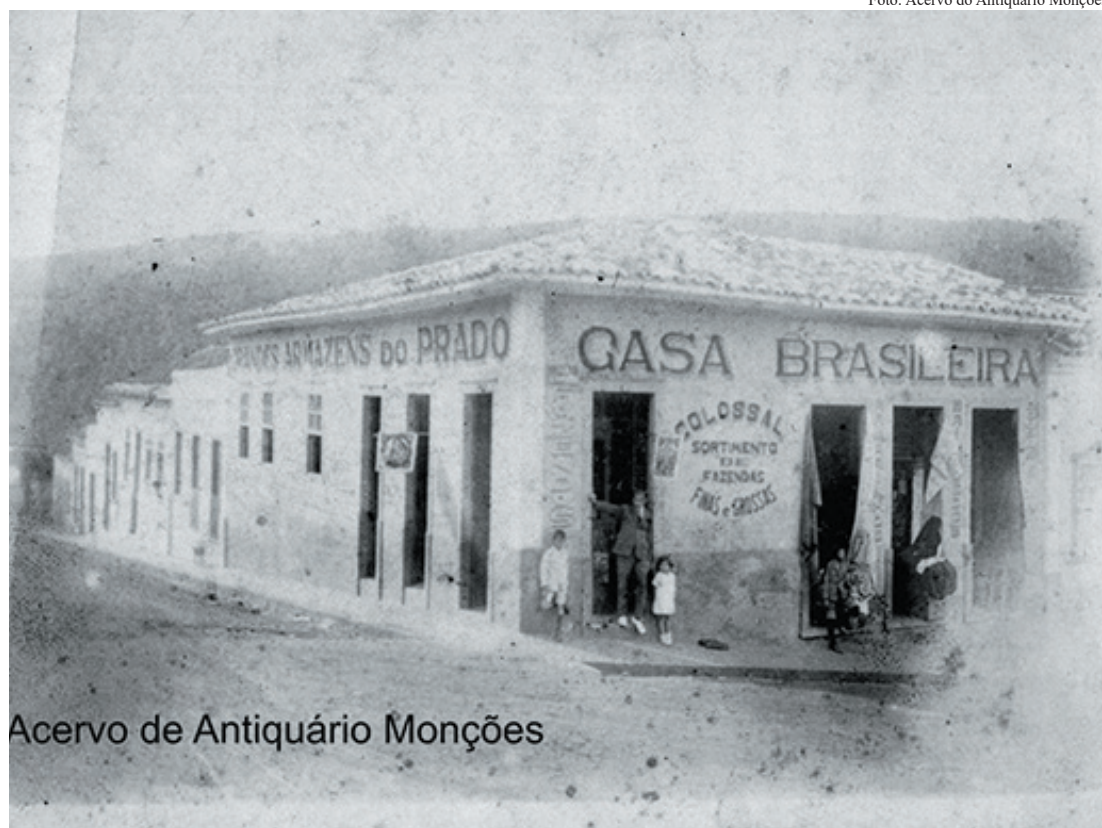
Acervo de Antiquário Monções