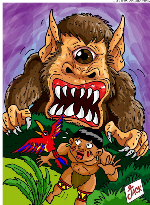
Ilustração: Domínio Público

Contudo além de nunca receberem qualquer resposta, ficavam