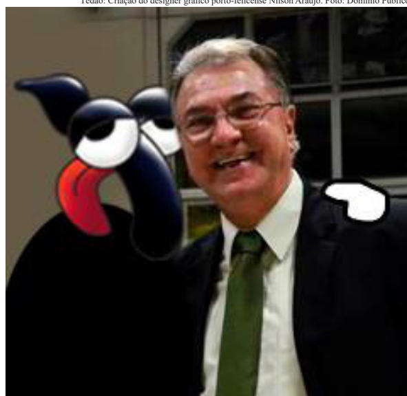
Tédão: Criação do designer gráfico porto-felicense Nilson Araújo.

Na condição de quem admira e por muitas vezes curte as performances do meme conterrâneo, certa vez ousei indagar como seria a vida social do “Tédão” – o primeiro personagem porto-felicense de histórias em quadrinhos -, pois os renomados personagens congêneres que conhecemos têm seus amigos e também seus