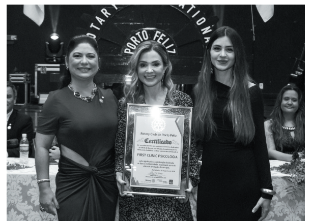
First Clinic Psicologia