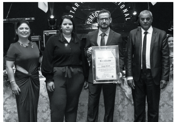
Grupo Belufi - Soluções Integradas para Construção Civil