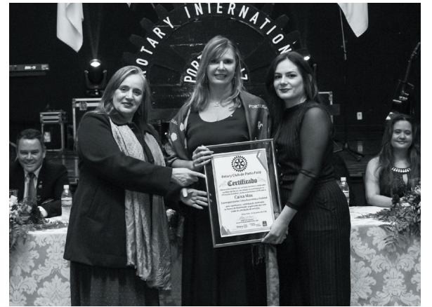
Caixa Max Correspondente Caixa Economica Federal