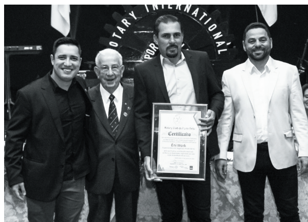
Eni Work Especialistas em Negócios Imobiliários