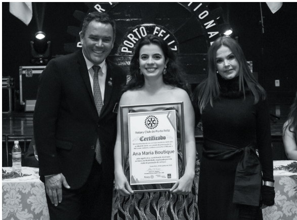
Ana Maria Boutique