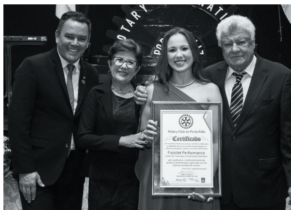
FisioVet Performance - Centro de Fisioterapia e Reabilitação Veterinária