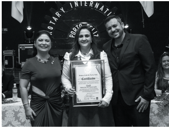
Giuli Materiais de Construção