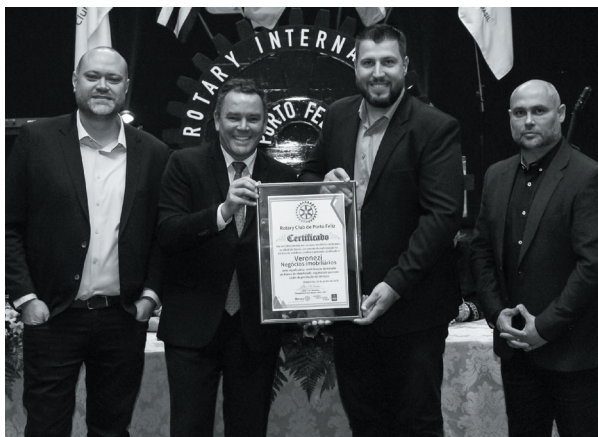
Veronezi Negócios Imobiliários