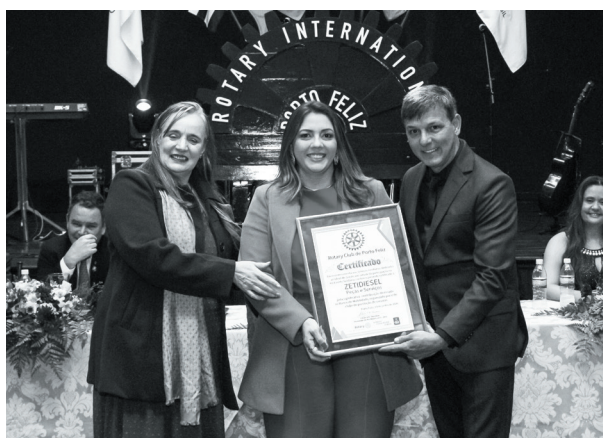
Zetidiesel - Peças e Serviços