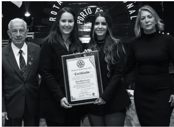
Bandimóveis Consultoria Ltda