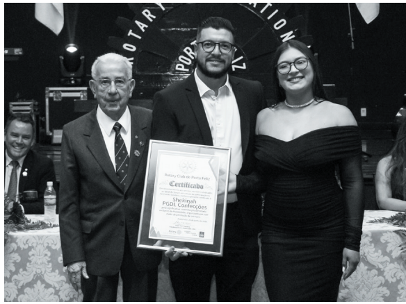
Shekinah / PGDL Confecções