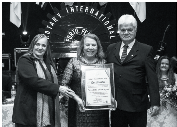
Porto Feliz Embalagens