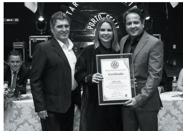
Villa Vet Centro Veterinário