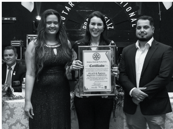
Alcalá & Ramos Negócios Imobiliários