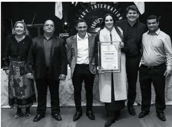
TRANSFARIA Auto Ônibus Porto Feliz Transportes e Turismo