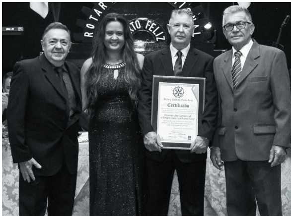
Associação Comercial e Empresarial de Porto Feliz