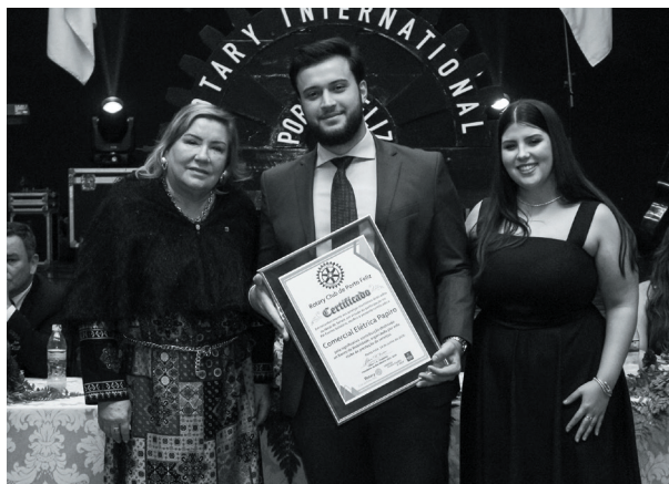
Comercial Elétrica Papiro