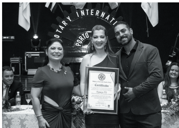
ISpaço TO - Clínica de desenvolvimento infantil