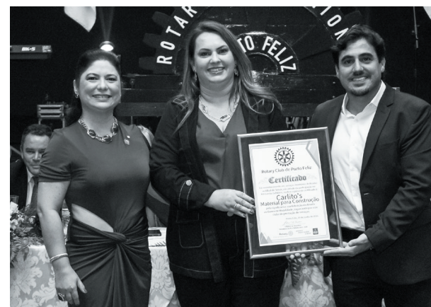
Carlito's Material para Construção