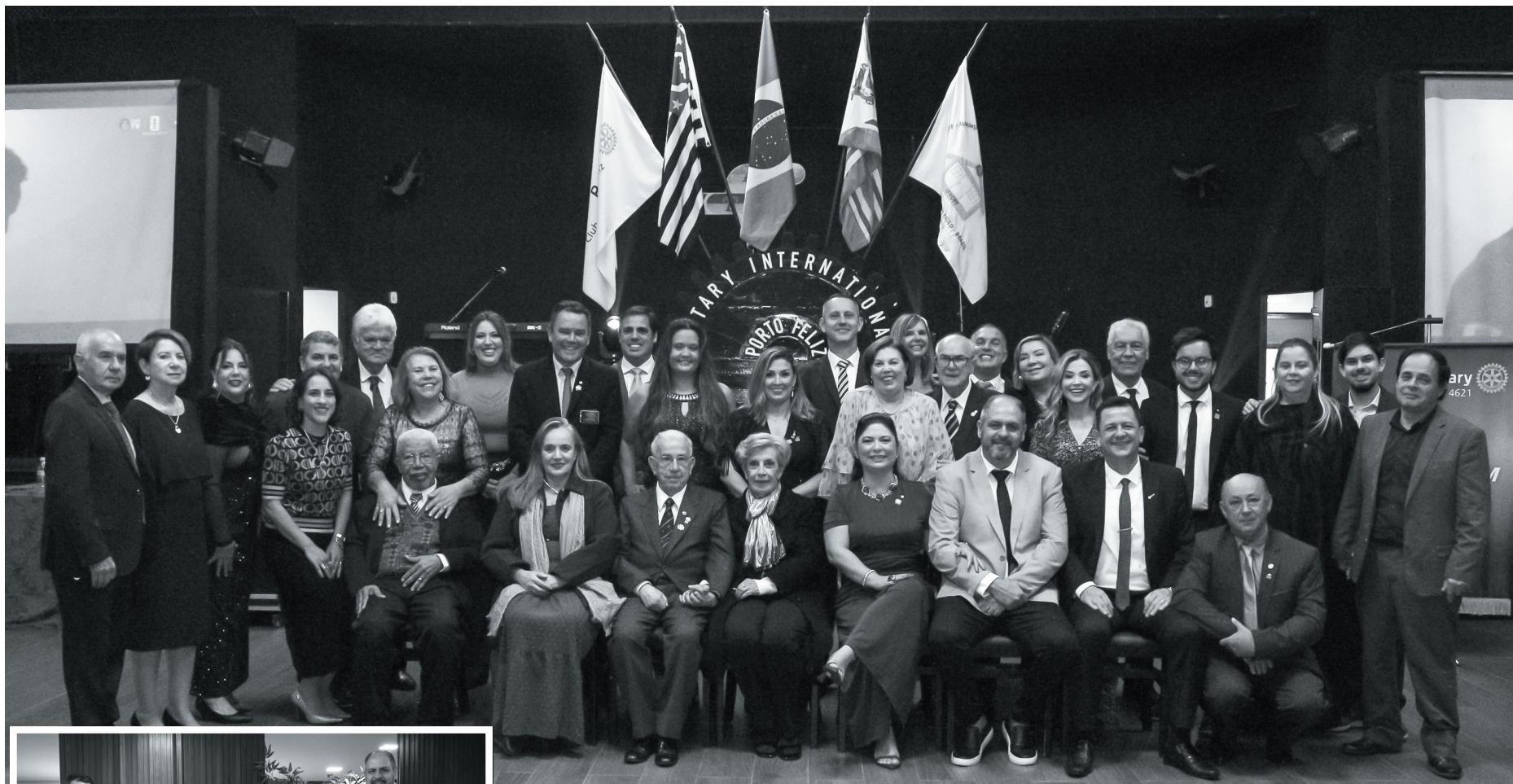
Após as premiações, os associados do Rotary Club Porto Feliz posaram para a tradicional foto com a Governadoria do atual Ano Rotário, que em 2025/2026 trabalhou com o lema “Unidos para Fazer o Bem”.