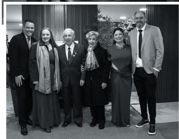
Na foto, a Governadoria 2025/2026 do Distrito 4621 ao lado da Governadoria 1999/2000 do então Distrito 4310 e da atual presidência do Rotary Club local, simbolizando a união entre diferentes gerações de lideranças rotárias, pautadas pelo compromisso de servir.