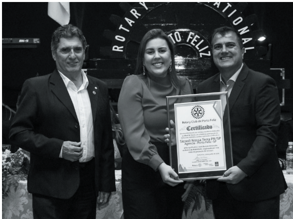
Sicredi Nossa Terra PR/SP Agencia - Porto Feliz -SP