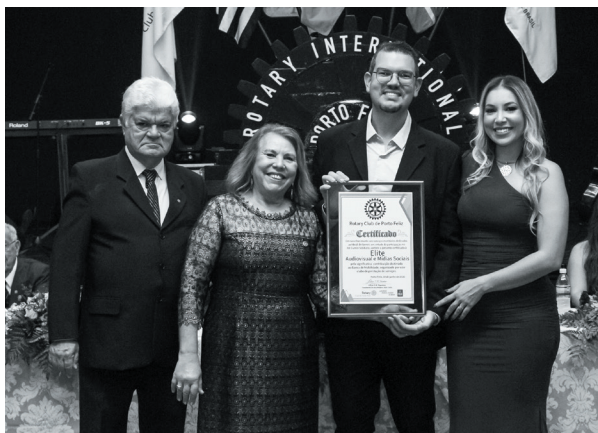
Elite Audiovisual e Mídias Sociais