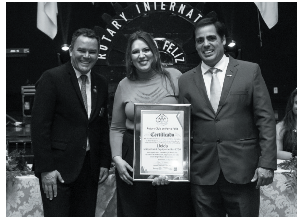
Lleida Máquinas & Equipamentos LTDA