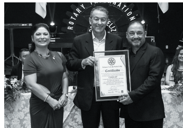
CANACAP - Cooperativa dos Plantadores de Cana da Região de Capivari