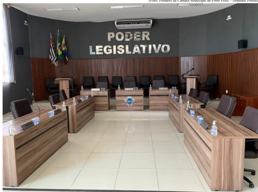
(Foto: Plenário da Câmara Municipal de Porto Feliz – Domínio Público)

A infraestrutura urbana também era assunto normalmente debatido entre os