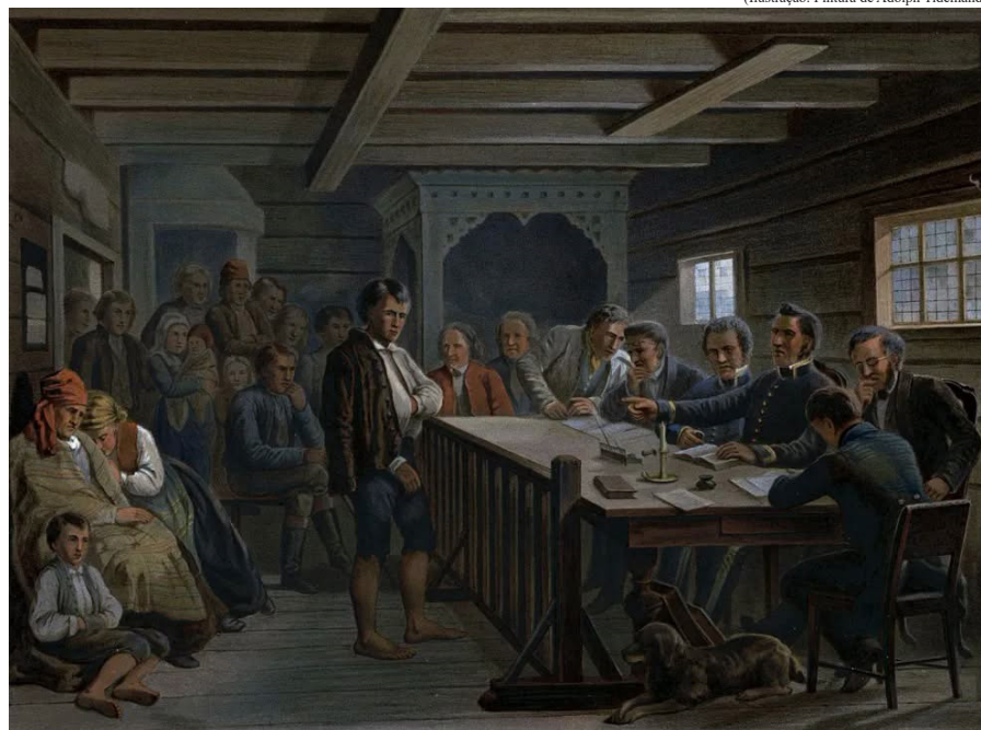
(Ilustração: Pintura de Adolph Tidemand)